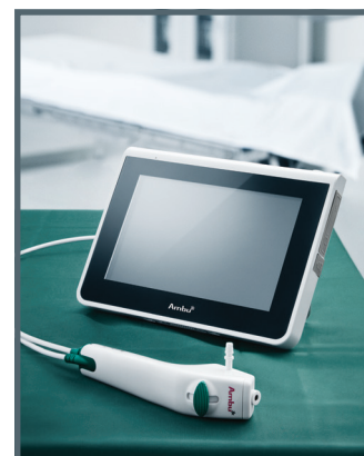
Ambu® aScope™ 3 e Ambu® aView™