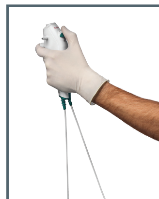
Impugnatura ergonomica e leggera progettata per il comfort ottimale dell'utente